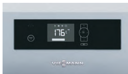
Régulation Ecotronic 100 à écran rétro-éclairé pour une utilisation simple et intuitive

Avec un fonctionnement modulant, la chaudière Vitoligno 150-S s'adapte en continu au besoin calorifique du moment. La régulation de combustion avec sonde lambda et sonde de fumées mesure en permanence la teneur en oxygène et la température des fumées. Elle assure une combustion propre et de faibles émissions polluantes et garantit un rendement maximal élevé jusqu'à 93,1 %. De façon économique, la chaudière Vitoligno 150-S transforme ainsi les bûches de bois en chaleur utile.